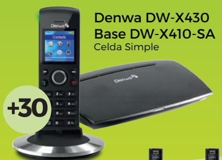
Denwa DW-X430 Base DW-X410-SA Celda Simple