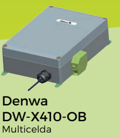
Denwa DW-X410-OB Multicelda