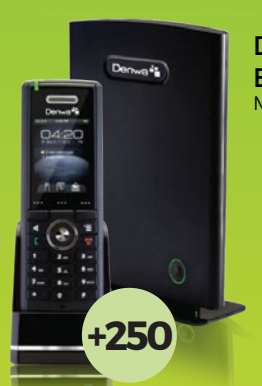
Denwa DW-X400 Base DW-X410 Multicelda